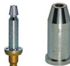
Pre horľavý plyn Propan, Methan, Mapp