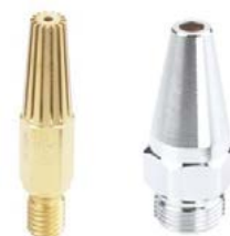
Pre horľavý plyn Propan, Methan, Mapp