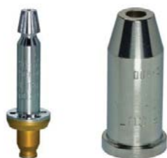
Pre horľavý plyn Propan, Methan, Mapp, Ethylen

Vysokovýkonné blokové, chrómované rezacie dýzy pre ručné rezacie horáky