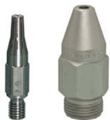
Horlavý plyn ACETYLÉN

Vysokorýchlostné kruhové drážkované rezacie dýzy pre Strojné rezacie horáky QUICKY a MS / MSZ, rezanie možné s vyšším tlakom kyslíka, pre ešte vyššiu kvalitu a rýchlosť rezu, rezacie dýzy so špeciálnou povrchovou úpravou pre minimalizovanie ulpievania okují a maximálnu životnosť