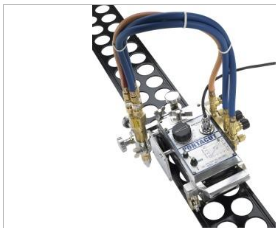
S jedným strojným rezacím horákom